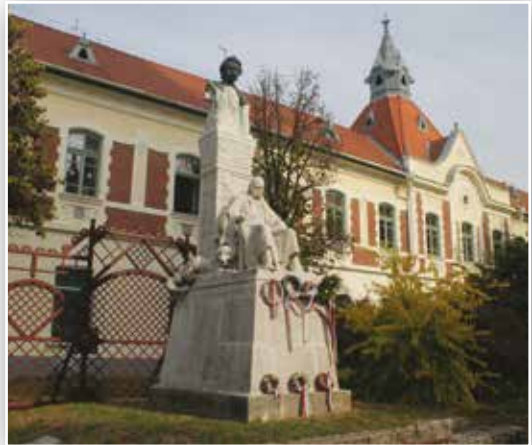
Stróbl Alajos Arany János szobra

A vén gulyás azonban a nagykőrösiek számára nemcsak történetiségében jelent sokat, hanem azért is, mert szimbólumává