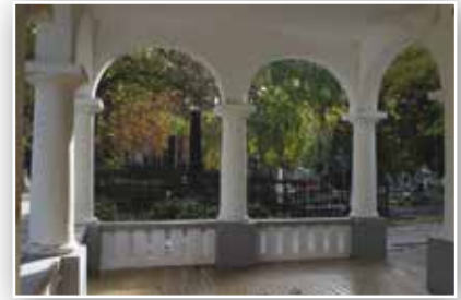
A ravatalozó oszlopos előtere, ahonnan jól látszik a kovácsoltvas kerítéssel elválasztott kripták sokasága

Történetileg Nagykőrösön úgy alakult, hogy a református temető vált a város fő temetőjévé. A Nagykőrösi Református Temető története és fejlődése nagyon jól példázza a város fejlődésének, és ezzel párhuzamosan a temető folyamatos átalakulásának összefüggéseit. A lakosság növekedésével és a korábbi temetőrészek lezárásával párhuzamosan folyamatosan új temetőrészt kellett nyitnia a városnak. A lezárt temetőket pedig a város az elmúlt századokban sorra felfalta, a lezárt temetőket területét sorra felparcellázták és beépítették.