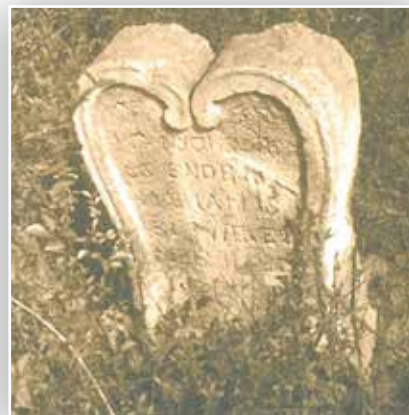
Szív alakú sírkő

rán egyre többen költöztek be a településre, így megnövekedett a katolikus lakosság száma is, részükre az 1940-es évek elején a temető északkeleti részében külön temetőhelyet jelöltek ki, ahová 1969-ig külön temetkeztek.